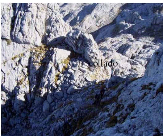
Foto del collado que separa el 3º y 4º Argao

Cuando lleguemos al collado entre la 3ª y la 4ª cumbre del Argao, sale una vira algo herbosa hacia la derecha (sentido de avance del cresterío), es fácil, ahí montamos reunión para hacer el paso del IV-. Es muy aéreo pero de corta trepada (unos 7m) y fácil.