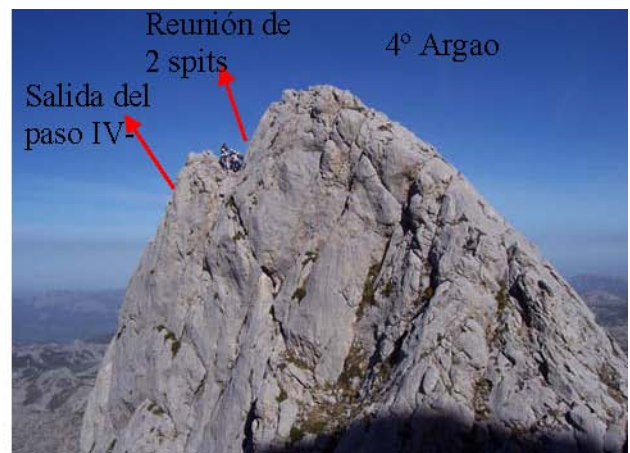
Salida del paso de IV- hacia el 4º Argao