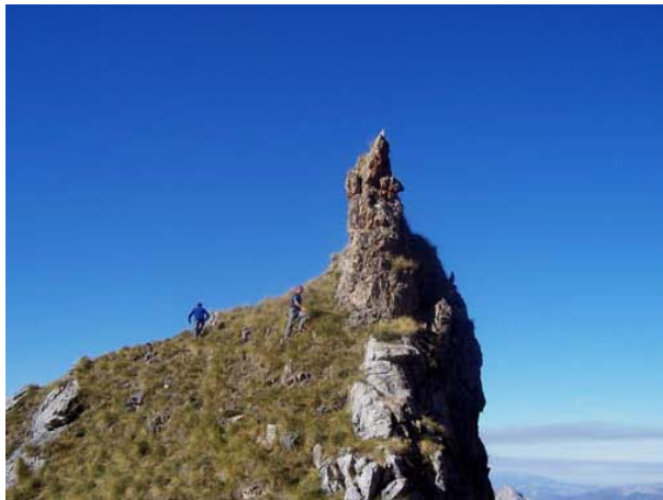
Collado Coterín de Marcos