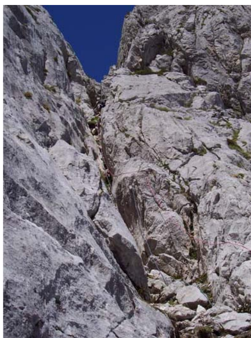
RAPELANDO LA CHIMENEA DEL 1º LARGO