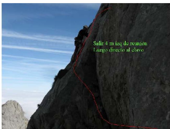
SALIDA DEL 2º LARGO