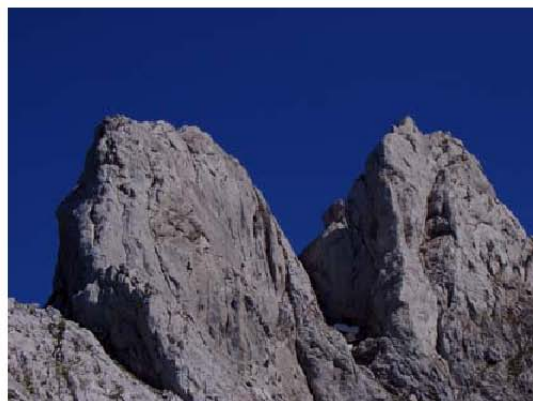
Segundo y tercer Poyón